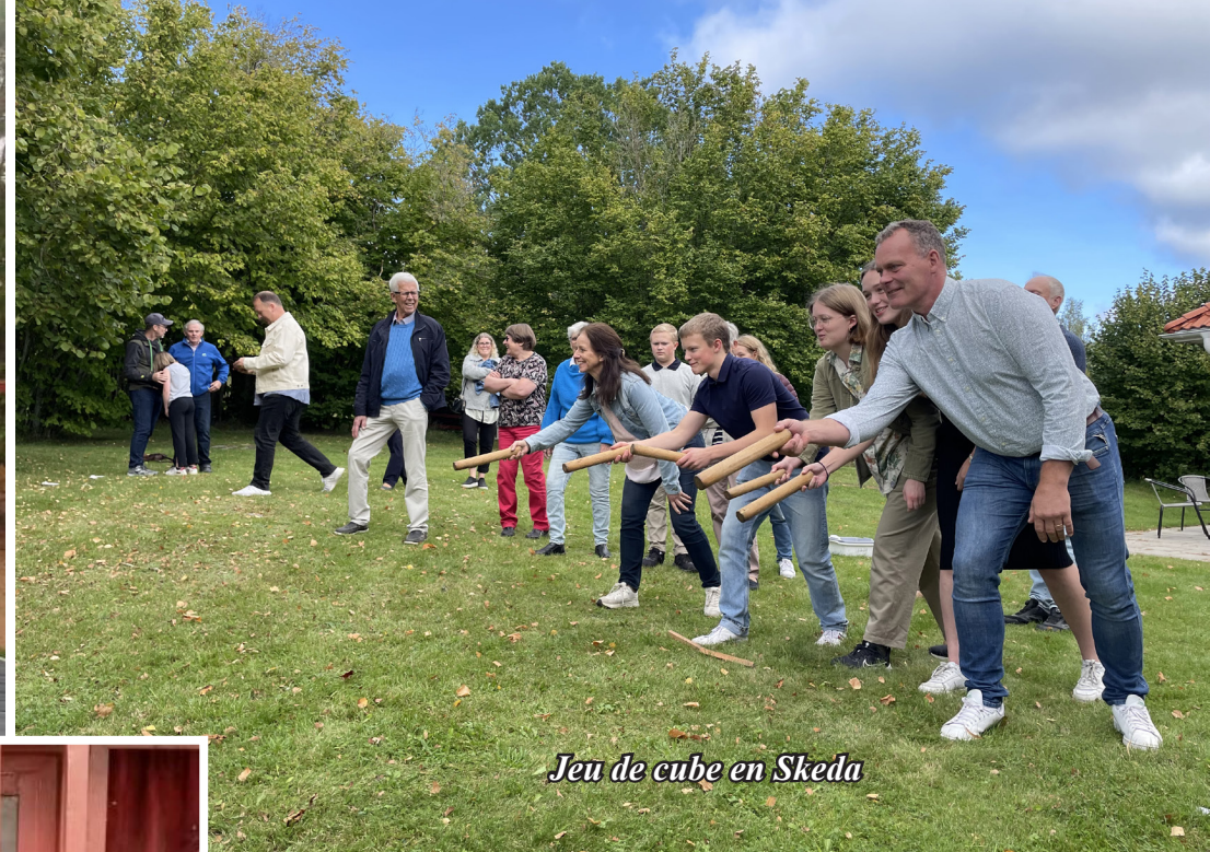
Jeu de cube en Skeda