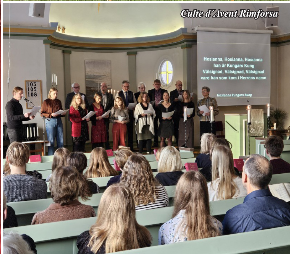
Culte d'Avent Rimforsa

Hosianna, Hosianna, Hosianna han är Kungars Kung Välsignad, Välsignad, Välsignad vare han som kom i Herrens namn