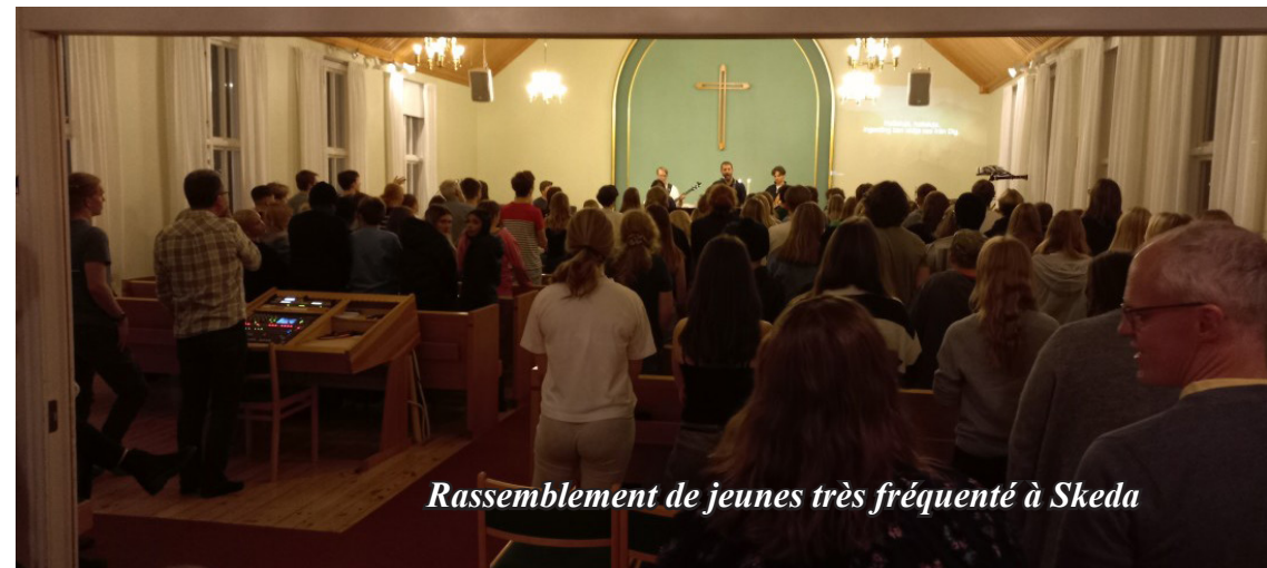
Rassemblement de jeunes très fréquenté à Skeda

Paroisse C.E.C. Mukimbungu BP 36 LUOZI Rép. Dém du Congo Tel +243 896 709 640 mabialadaniel335@gmail.com