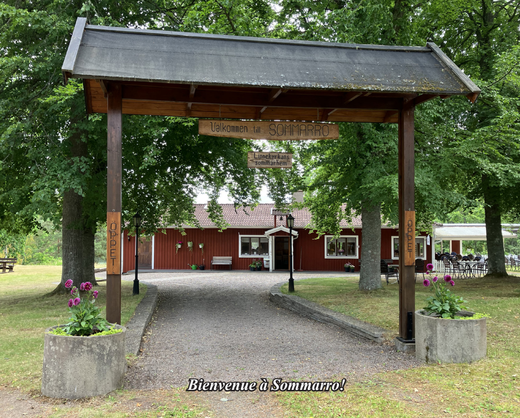
Bienvenue à Sommarro!