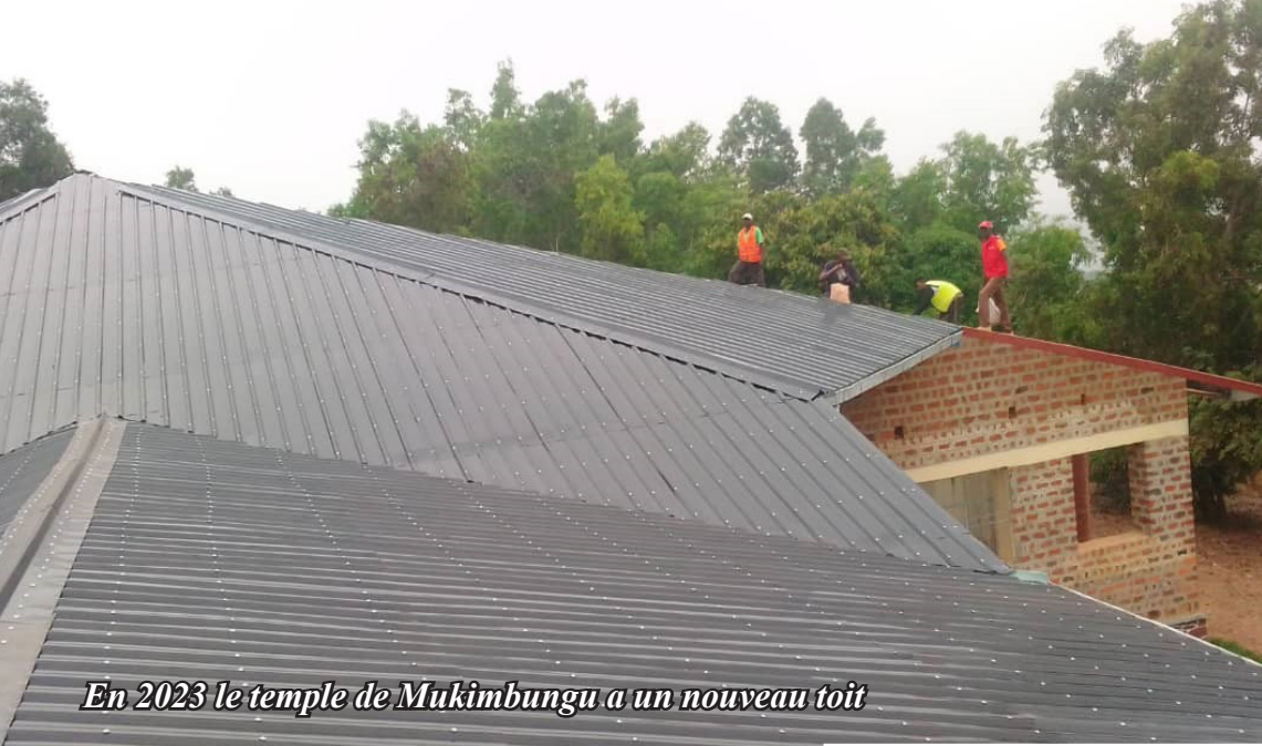
En 2023 le temple de Mukimbungu a un nouveau toit