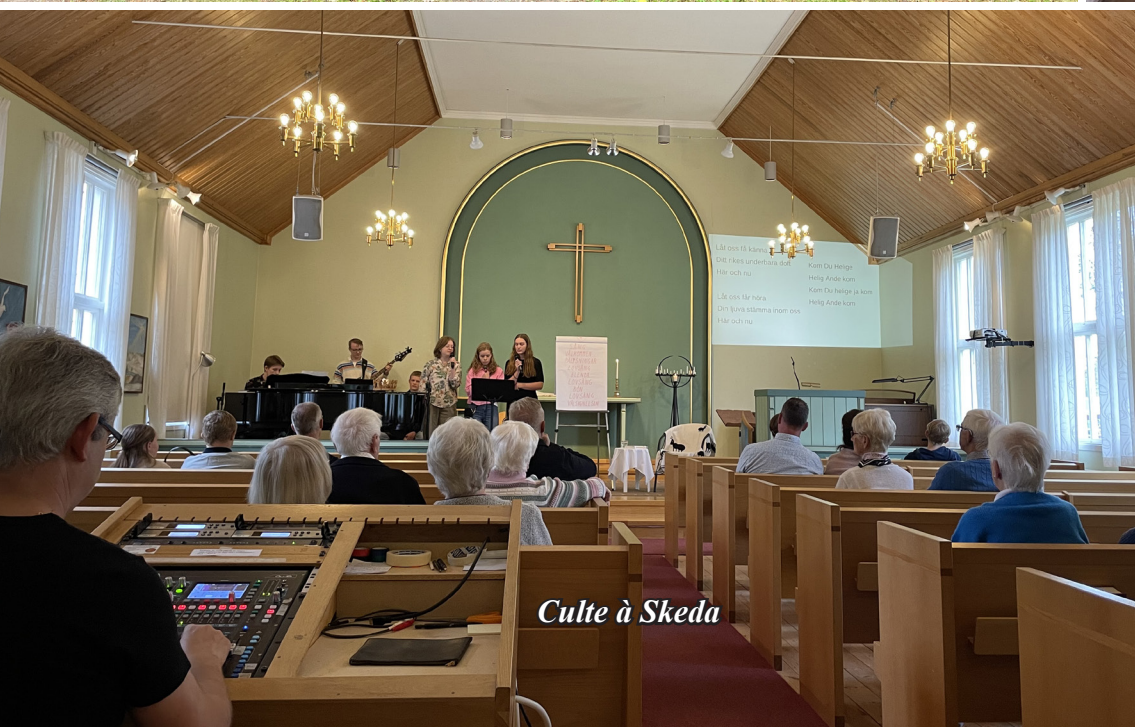
Culte à Skeda