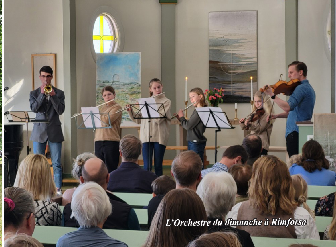
L'Orchestre du dimanche à Rimforsa