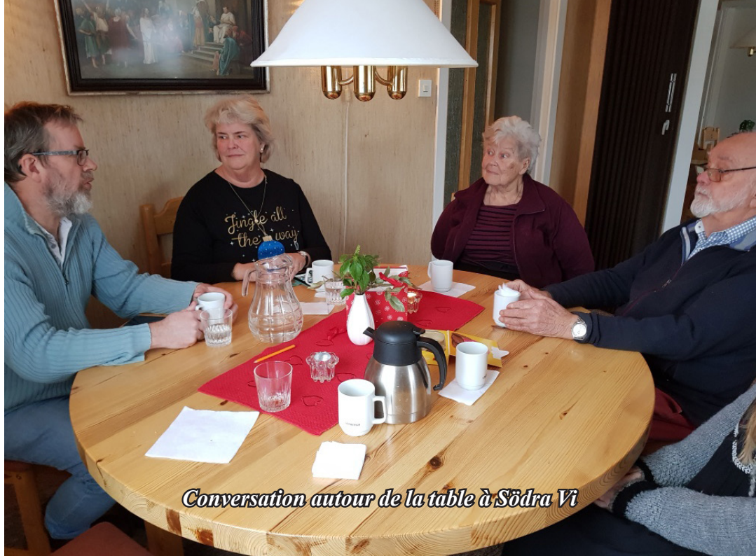
Conversation autour de la table à Södra Vi